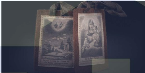
Escapulário de Nossa Senhora do Carmo

O escapulário é uma tira de pano feita do hábito que os frades e freiras da Ordem do Carmo usam e que recorda o modo de vida carmelita, a familiaridade com Maria, a oração, a imitação e a presença da virtude. O Papa Paulo VI consentiu que o escapulário pudesse ser substituído, depois da imposição, pela medalha de Nossa Senhora do Carmo, com o Sagrado Coração de Jesus no seu reverso.