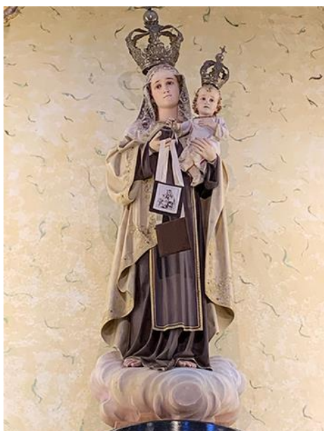
Imagem de Nossa Senhora do Carmo Igreja de Penha de França

Em 16 de Julho de 1251, enquanto São Simão Stock rezava, apareceu-lhe Nossa Senhora do Carmo que lhe entregou o escapulário, dizendo-lhe que "aquele que morrer usando o escapulário com devoção não padecerá no fogo do inferno, sairá do purgatório o quanto antes e terá a proteção e intercessão da Virgem Maria em todos os momentos da vida, da morte e mais além" .